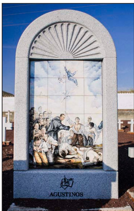
Mosaico en el cementerio de Paracuellos